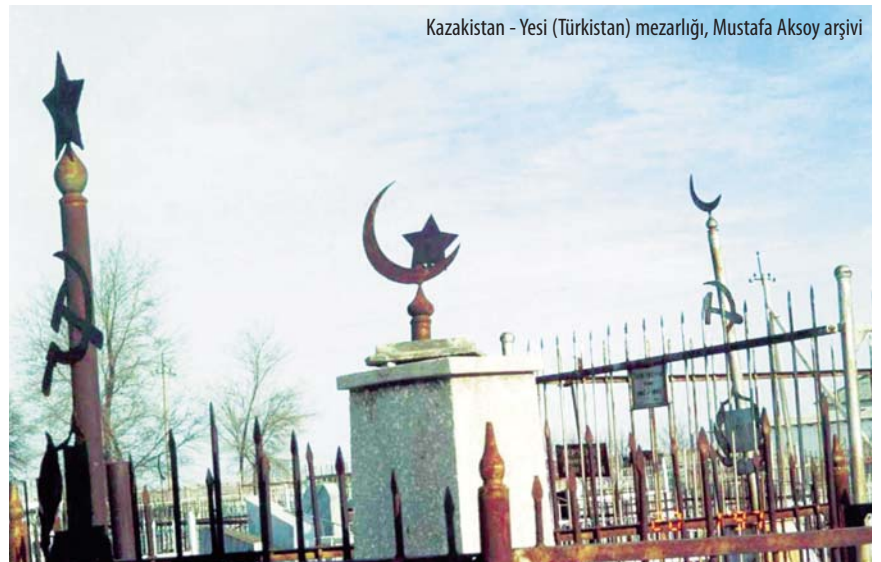
Kazakistan - Yesi (Türkistan) mezarlığı

man olmayan diğer milletlerin mensupları ölenlerini defnediler. Sadece Kırgızistan / Bişkek'te, Kırgız asıllı önemli şahsiyetlerin olduğu mezarlığın bir tarafında Kırgızların, diğer tarafında ise Yahudilerin mezarları bulunmaktadır.