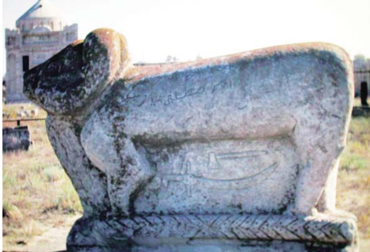
Kazakistan Mangıçlak