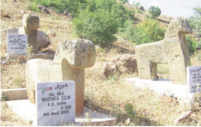
Tunceli Pülümür

Mezarların biçimleri, onların kimlere ait olduğu konusunda hiç bilgisi olmayanlara dahi önemli ipuçları vermektedir.